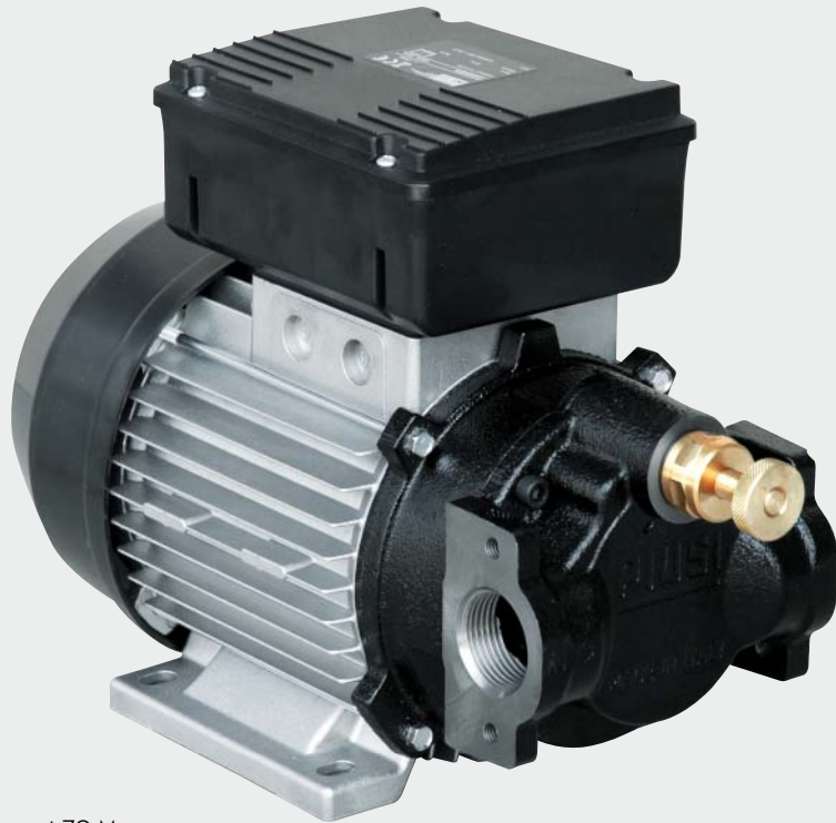
Viscomat 70 M